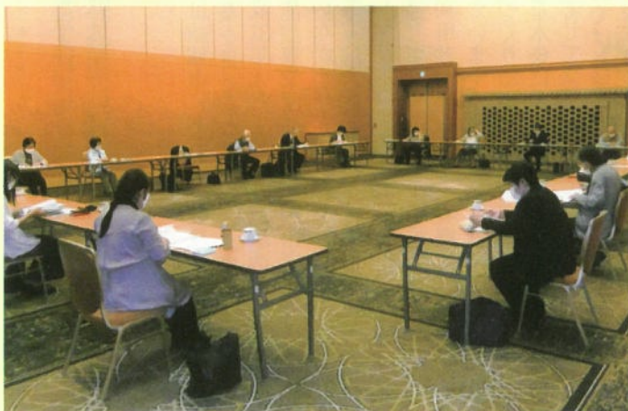
ソーシャルディスタンスをとった理事会会場