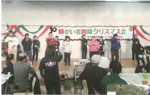
障がい者週間クリスマス会

発行日 令和2年12月10日 発行 一般社団法人 茨城県手をつなぐ育成会 編集 広報委員会 事務局 〒310-0851 水戸市千波町1918 茨城県総合福祉会館内 ☎ 029-243-3838 FAX 029-243-3854 URL http://www.ibaikuseikai.com/ e-mail iba-ikuseikai@bz03.plala.or.jp