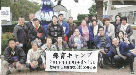
療育キャンプ (千葉県鴨川)