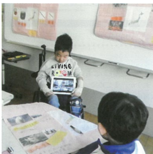
B部門 小学部 I 課程 総合的な学習の時間