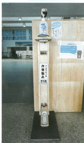
A部門 高等部 作業学習 新製品「足踏み式オートディスペンサー」