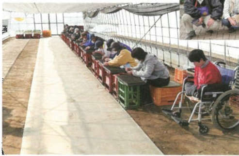
コロナ禍での種まき