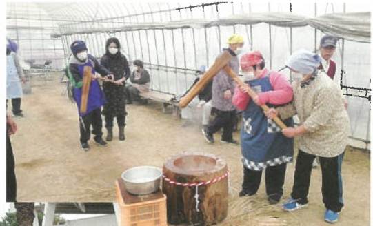
地域交流事業餅つき体験