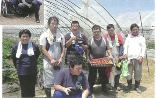
農業収穫体験 (いちご狩り)