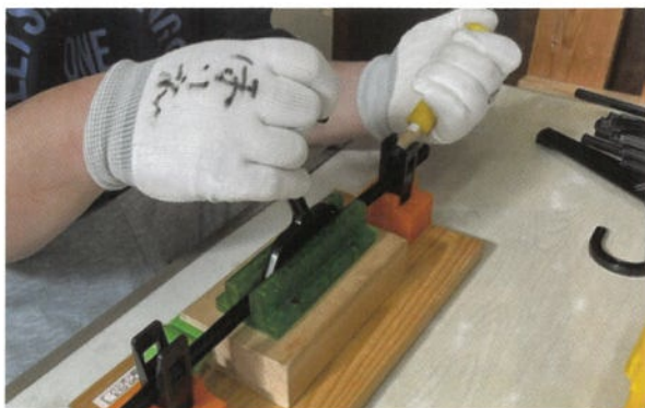
開発した治具での作業

発行日 令和5年12月10日 発行 一般社団法人 茨城県手をつなぐ育成会 編集 広報委員会 事務局 〒310-0851 水戸市千波町1918 セキショウ・ウェルビーイング福祉会館内 ☎ 029-243-3838 FAX 029-243-3854 URL http://www.ibaikuseikai.com/ e-mail iba-ikuseikai@bz03.plala.or.jp