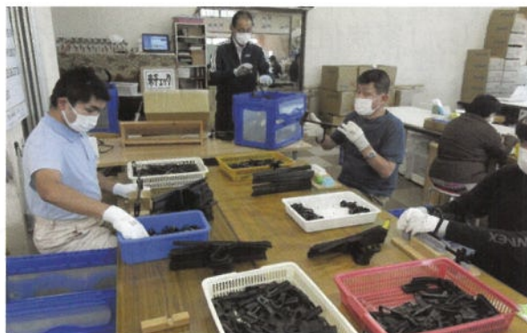
毎日の作業訓練の様子（ハンガー組み立て）