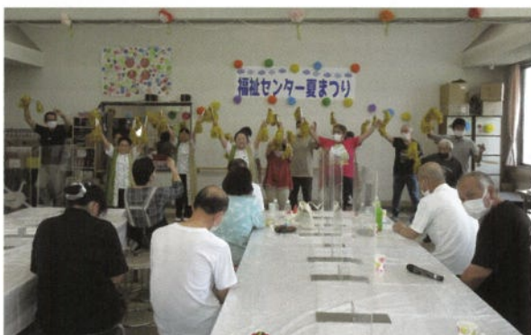
夏まつりでのよさこいソーラン踊り