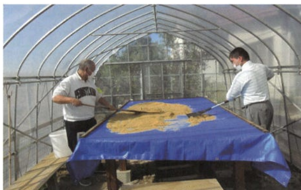
自主製品の EM ボカシ作り